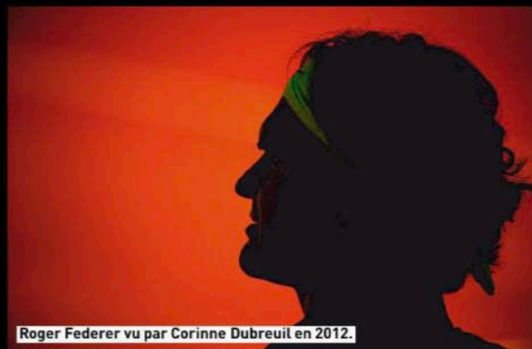
Roger Federer en 2012.