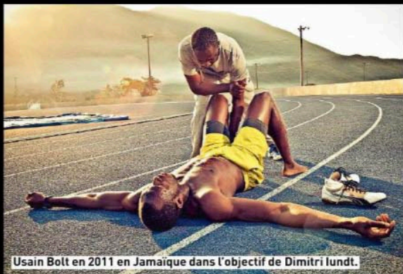
Usain Bolt en 2011 en Jamaïque.

Exposition « Art et sport, la rencontre », jusqu'au 29 août au palais des Congrès Odyssée, à Saint-Jean-de-Monts (Vendée).